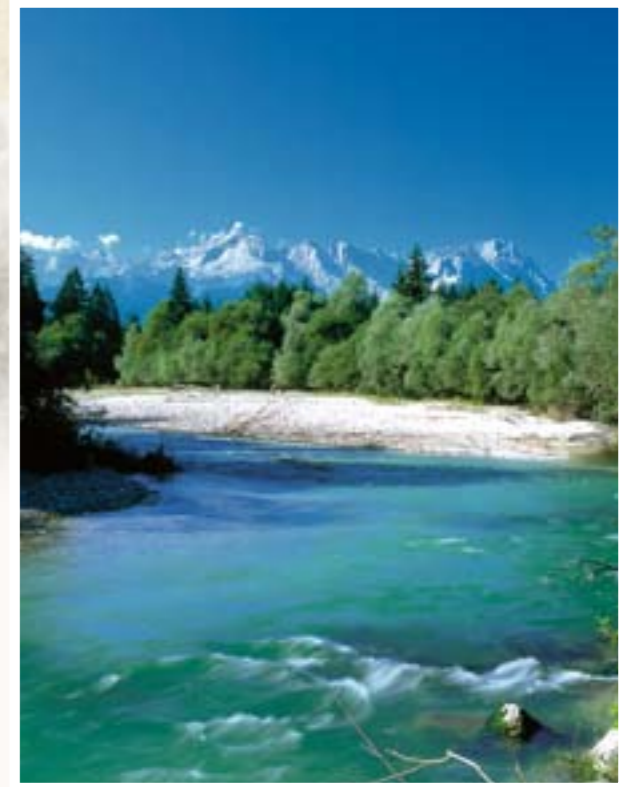
In den Loisachauen bei Oberau