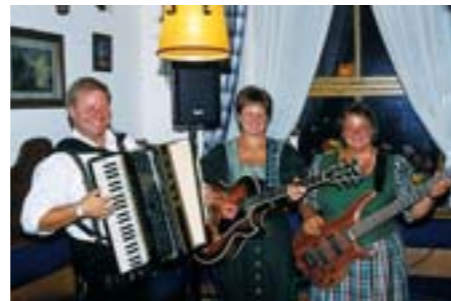
Wir freuen uns auf Ihr Kommen!

Herzlich willkommen beim Gästebegrüßungsabend Gästebegrüßungsabende, die aktuelle und interessante Urlaubsinformationen vermitteln, finden von Mai bis September statt. Umrahmt wird der Abend von echter bayerischer „Stubnmußi“ und Schuhplattlern. Ein wunderschönes, gelungenes, informatives und unterhaltsames Programm führt Sie durch den Abend. Selbstverständlich ist der Eintritt mit der Gästekarte frei.