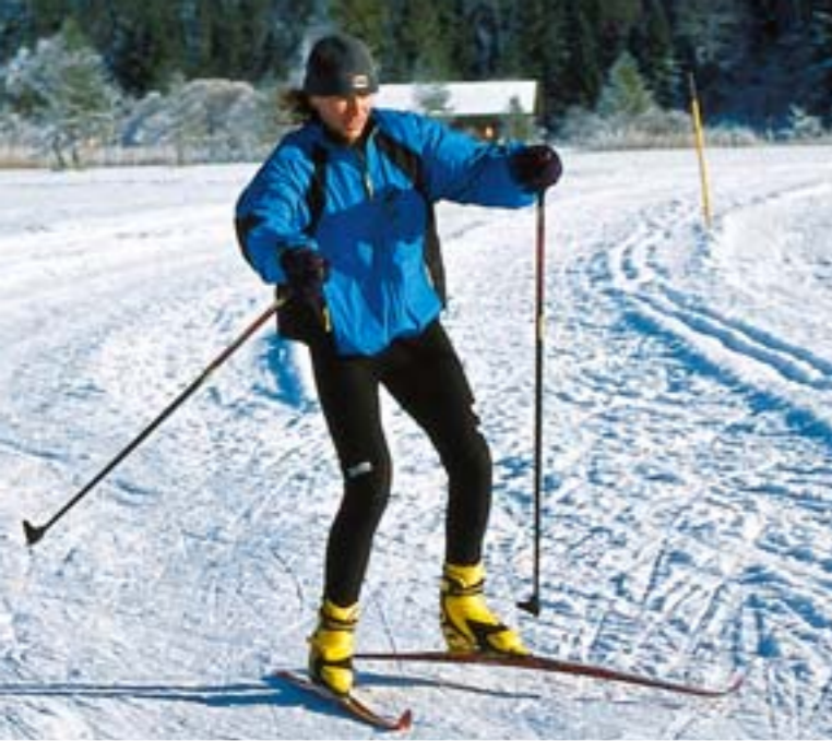
Auf der Loisachtalloipe